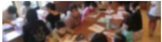
【R6. 8. 2 大学生と一緒に宿題に取り組む様子】

また、北原町会が十文字学園女子大学の星野 教授と連携して、「北原宿題応援隊」を開催しま した。約30名の子供たちが参加し、大学生に 宿題を見てもらったり、一緒に遊んだりして、 楽しく過ごしていました。また、参加者には地 域の方が作ったカレーライスが提供され、皆で 美味しくいただきました。