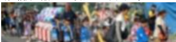
【R6. 7. 27 石神町会夏祭り～子供神輿の練り歩き～】

この夏休みに地域のいくつかのイベントに参 加させていただきました。石神町会、北原町会そ れぞれの夏祭りでは、様々な出し物とおおして地 域の活力と賑わいが伝わってきました。