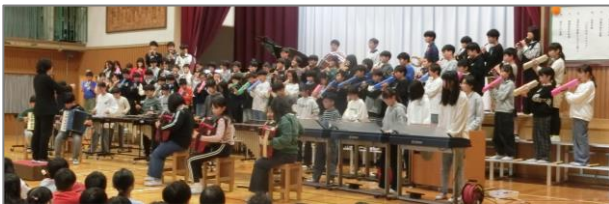
【R6.11.27 ミニ音楽会6年合奏「残酷な天使のテーゼ」】

「学校公開」は、公開日を3日間設けて参観できる時間に幅をもたせて実施しました。教員も動きやすい服装で授業を行い、飾り気のない普通の授業の様子をご覧いただきました。「ミニ音楽会」は5年ぶりに体育館で実施しました。広い体育館でのびやかに表現する子供たちの姿から、石神っ子のパワーと豊かな表現力を感じました。ある保護者がお帰りの際、「アットホームな音楽会だったね」とつぶやいてくださったことが嬉しかったです。